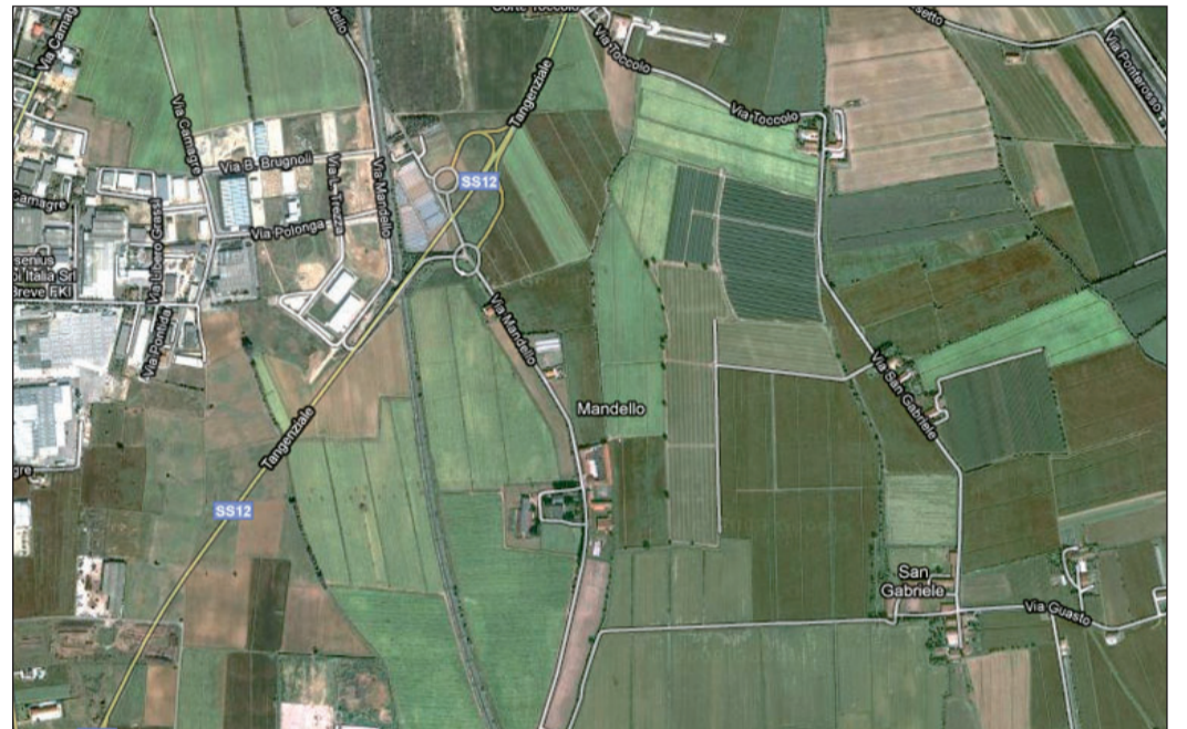
L'area del Mandello, dove sorgerà l'Interporto